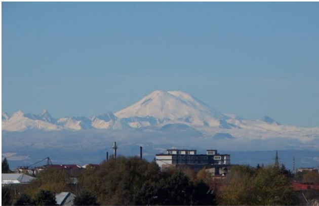
Кабардино-Балкария. Город Прохладный. Вид на потухший вулкан Эльбрус