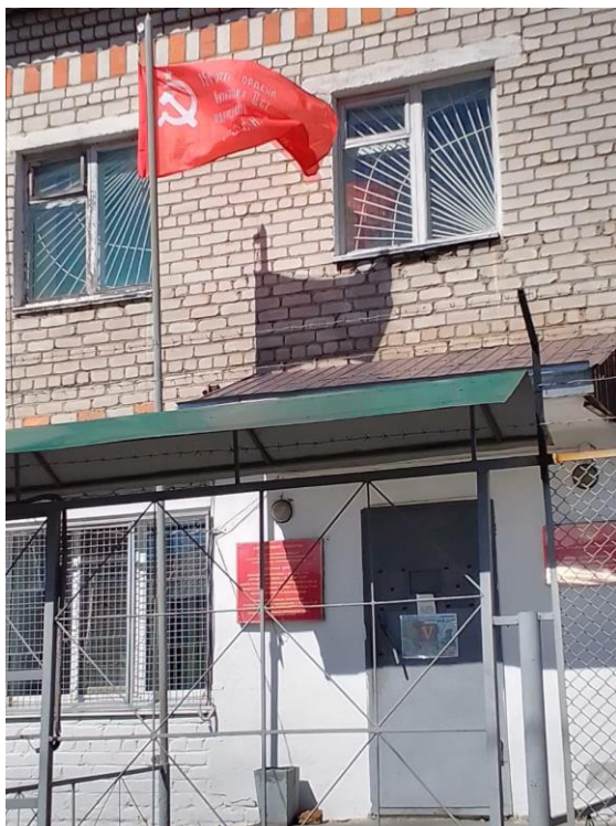
Красный флаг на крыльце военкомата пос. Новобурейский, Амурская область

Скоро придёт время и красный флаг СССР будет реять над Кремлём!