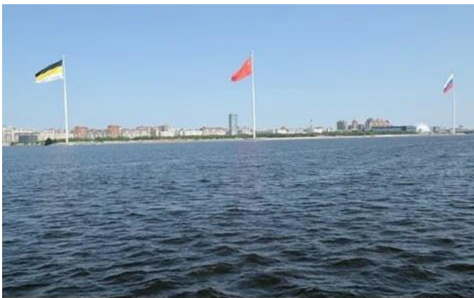
Два Государственных флага (слева на право): Российской Империи и Союза Советских Социалистических Республик (СССР). Третий флаг -торговой компании РФ-России. Вид на флаги со стороны Финского залива (Ленинград - Санкт-Петербург) середина августа 2024 года

Пробитое пулями, обгаренное кровью, красное знамя стало священной реликвией.