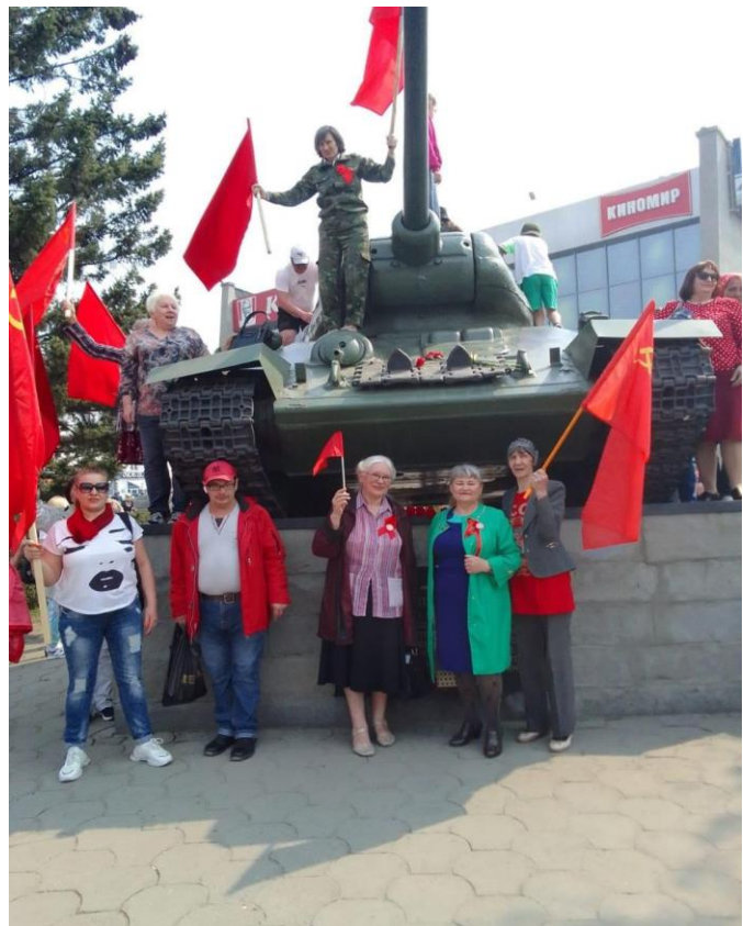
Алтайский край, г. Барнаул. 9 мая 2024 года