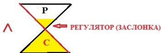
Рис. 2. Образ песочных часов (разрушение и созидание)