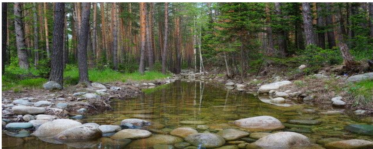
Ручей в Барнаульском ленточном сосновом бору.

Специально для школьников лесоводы собрали интересные факты, красноречиво говорящие о пользе ленточных боров. Например, что сосновые насаждения способны собрать из воздуха пыли до 32 тонн на 1 га. Бор защищает посеы от эрозии. При снижении покрытой лесом площади с 5 до 1% повреждаемость посевов ветрами увеличивается на 55%. Без ленточных боров при сильных бурях накопленный тысячами плодородный слой почвы может быть уничтожен за считанные минуты, так как своими мощными корнями сосны сдерживают миллионы тонн песка.