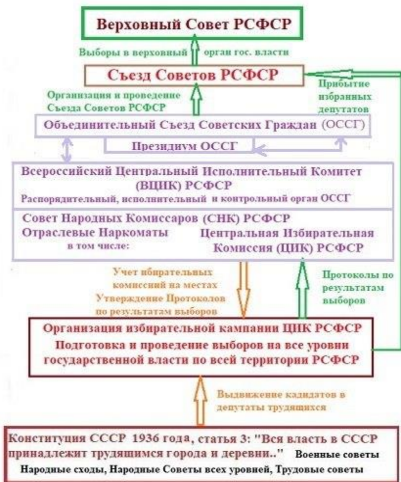
Рис. 1. Принципиальная схема возрождения народной Советской власти в 2023-2027 г.г. (переходной период)

Газета «Страна Советов» Выпуск № 25 от 22 марта 2025 года имеет 5 приложений, они будут опубликованы поочерёдно, сначала Приложение № 1 на 15 листах.