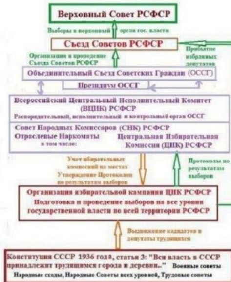
Рис. 1. Принципиальная схема возрождения народной Советской власти в 2023-2027 г.г. (переходный период)

Приложение к схеме: Пояснительная записка на 2-х листах