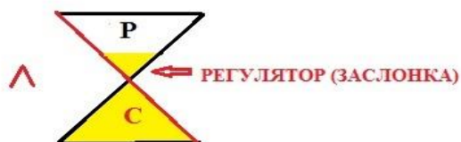
Рис. 2. Образ песочных часов (разрушение и созидание)

На рис. 2, на примере работы ПЕСОЧНЫХ ЧАСОВ показана схема процессов СОЗИДАНИЯ и РАЗРУШЕНИЯ .