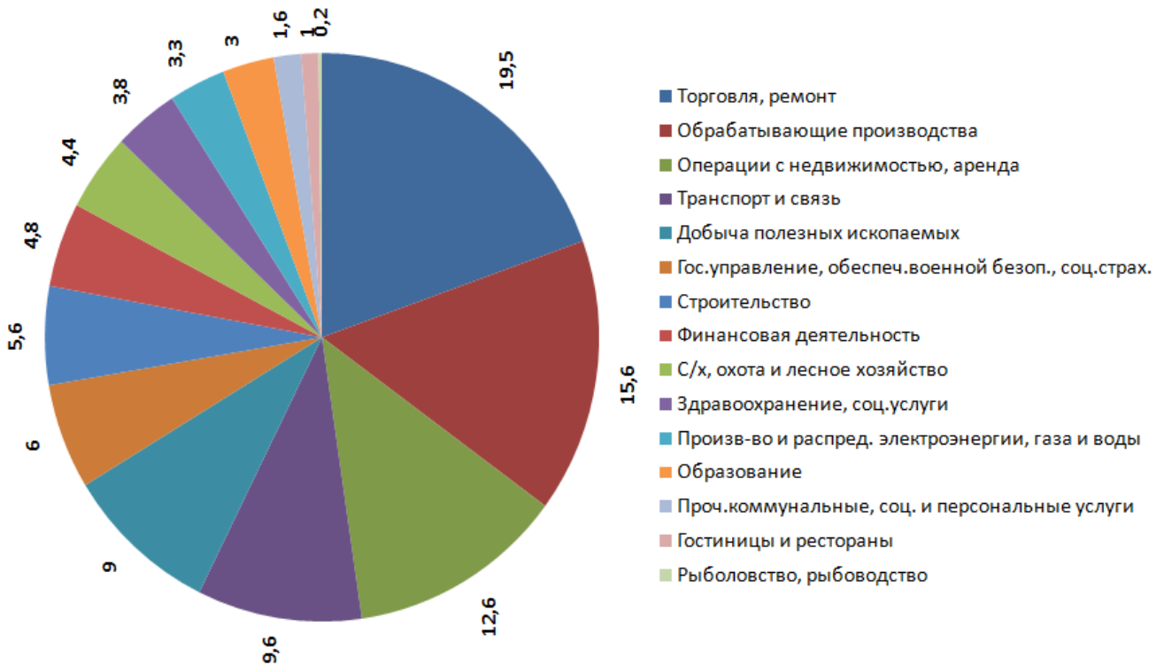
Рис. 4. Отраслевая структура экономики России в 2009 году (цифры приведены в % от общей величины экономики)

Из диаграммы следует, что первые 3 места занимают такие отрасли: Торговля, ремонт -19,5 %; обрабатывающее производство – 15,6%; операции с недвижимостью, аренда – 12,6 %. Места с 4-го по 9 (показатель от 9,6 до 4,4 %) занимают такие отрасли как: Транспорт и связь; Добыча полезных ископаемых; ГОСУПРАВЛЕНИЕ, Обеспечение военной безопасности, социальное страхование; Строительство; Финансовая деятельность; Сельское хозяйство, охота и лесное хозяйство.