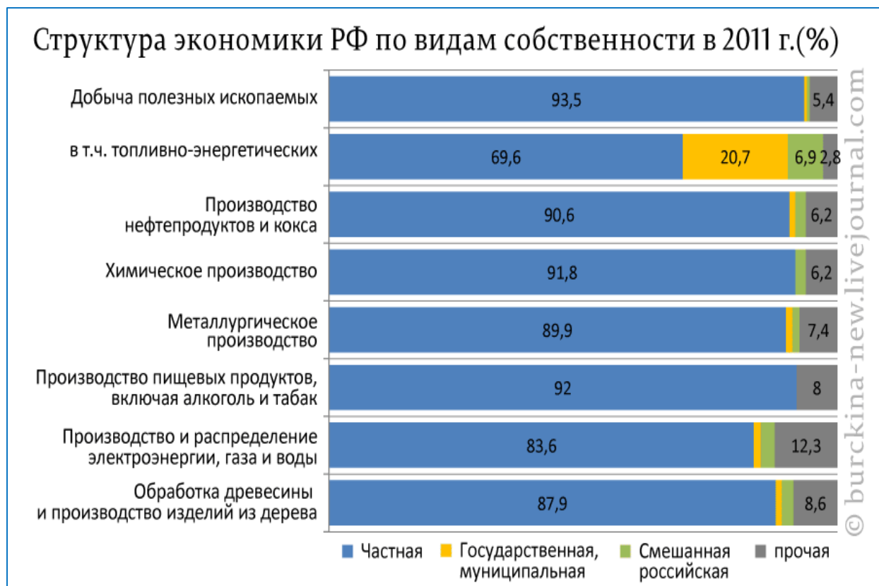
Рис. 5. Структура экономики РФ по видам собственности в 2011 г. (%)

В результате структура экономики по видам собственности на основные средства производства имеет ярко выраженное преобладание ЧАСТНОЙ СОБСТВЕННОСТИ .