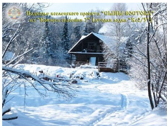
Зимний пейзаж на подворье "Ковчега спасения 2", Кемеровская область, РСФСР